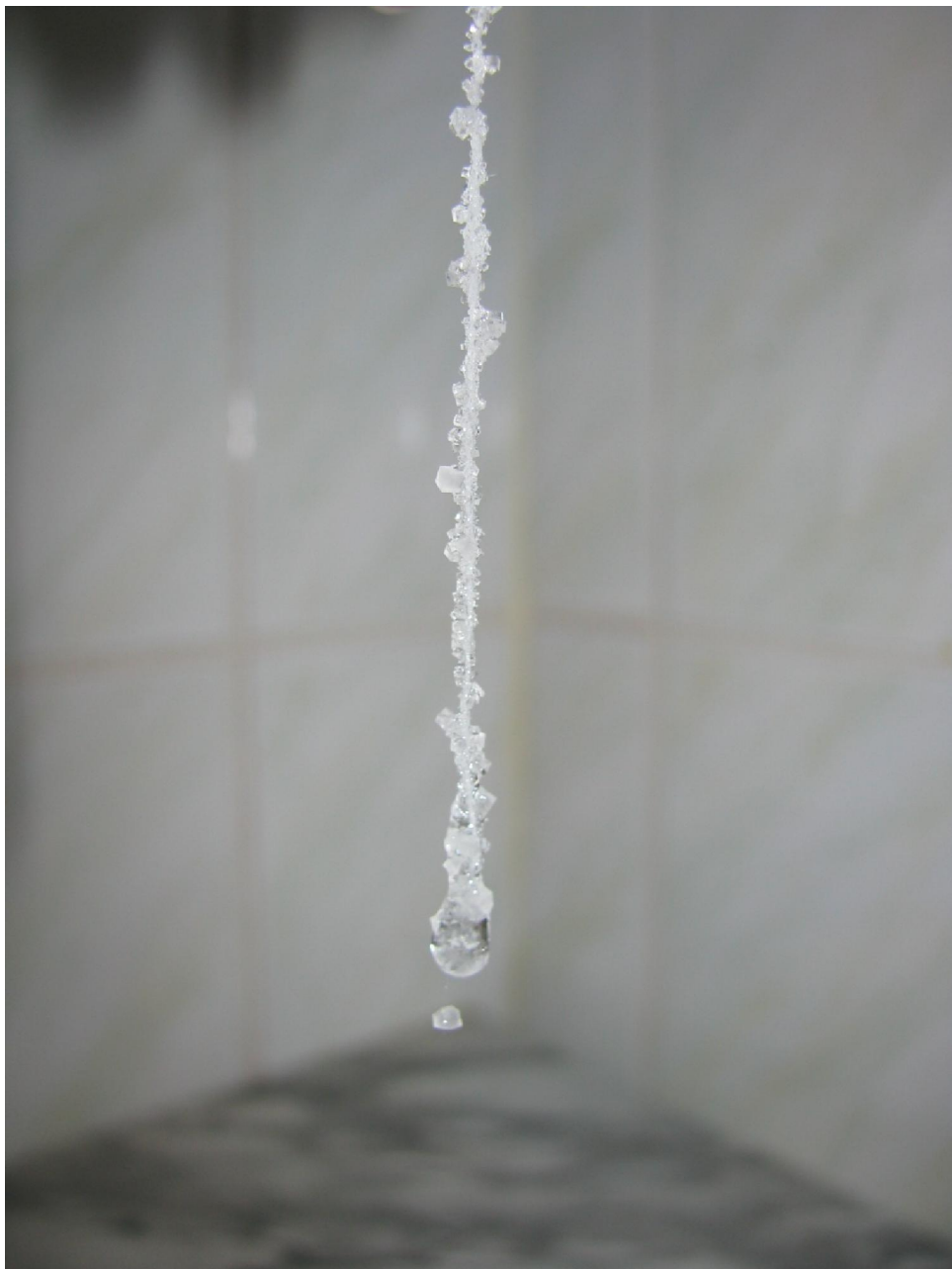
Кристалл из раствора хлорида натрия через 7 часов роста