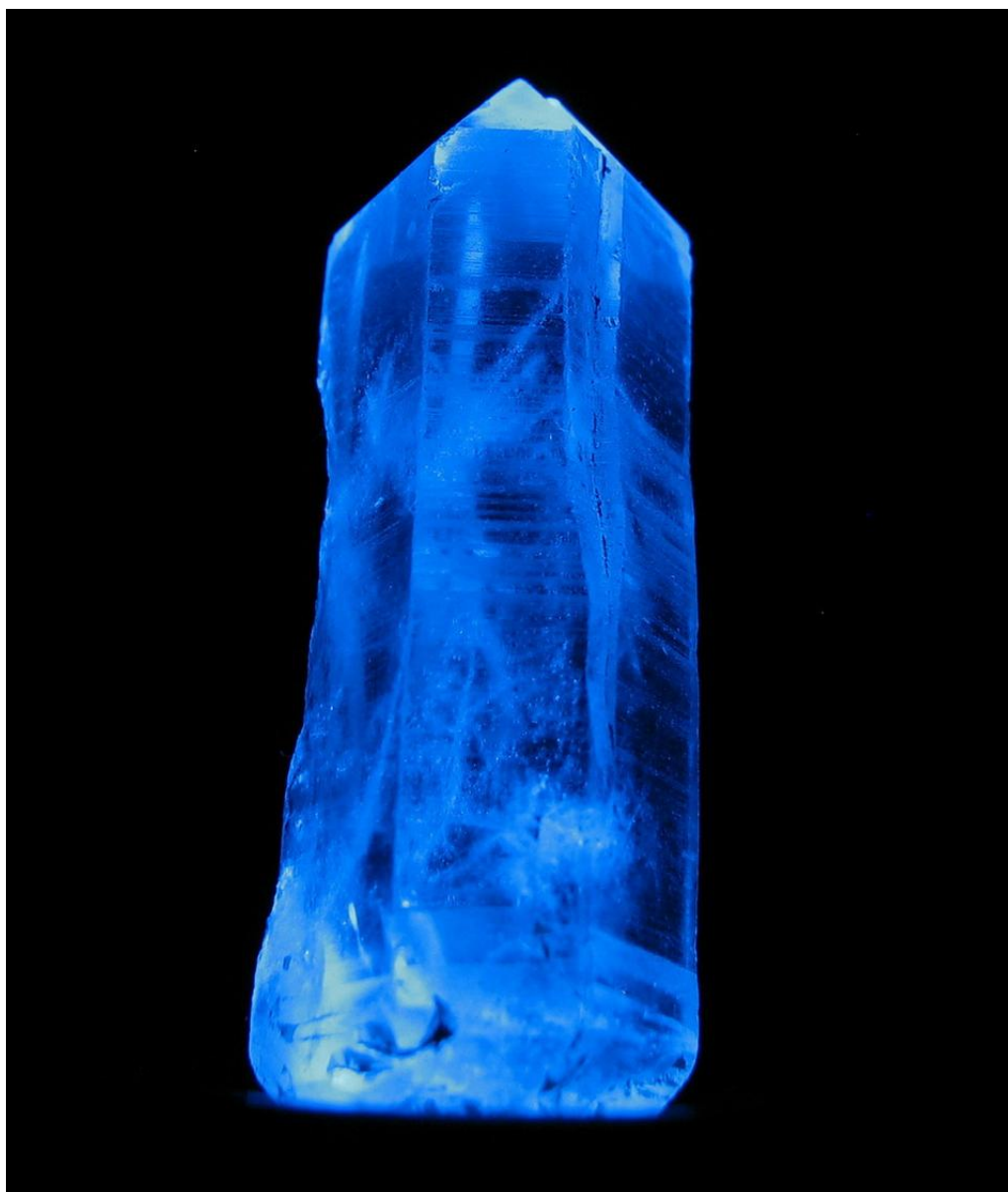
Кристалл горного хрусталя