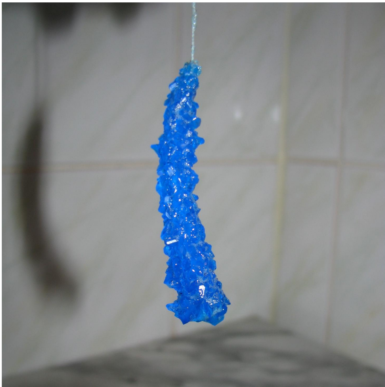
Кристалл из раствора медного купороса через 7 часов роста