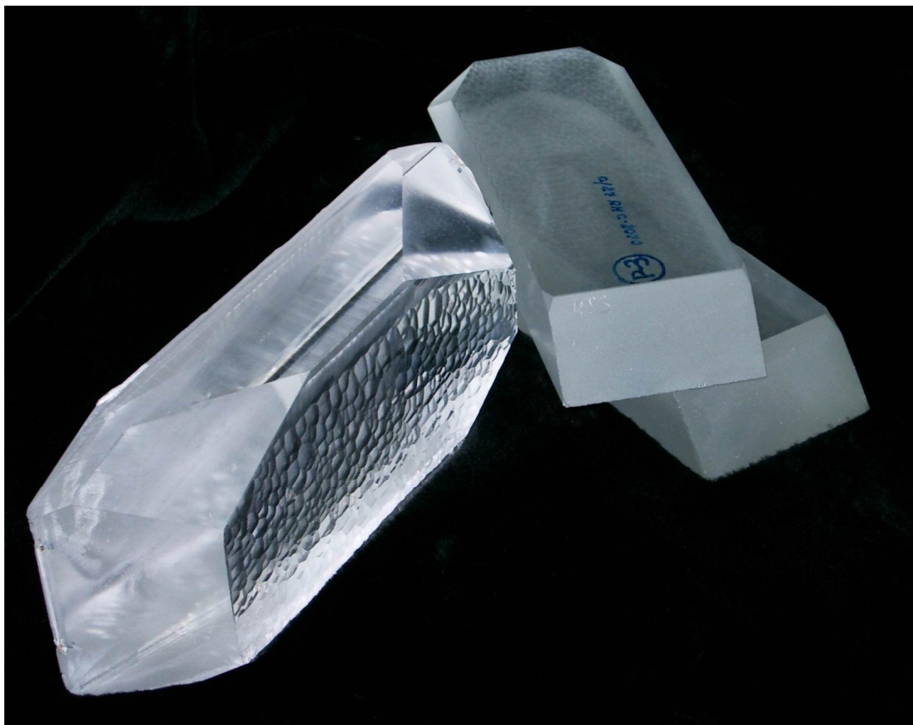
Кристаллы оптического кварца